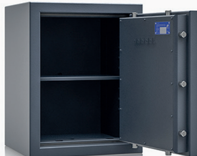
* Modell Ginan3 70

Mechanisches Kombinationsschloss 3390 (Aufpreis – Art. P80120)