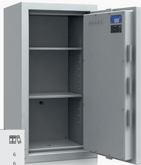
* Modell Libertas4 100